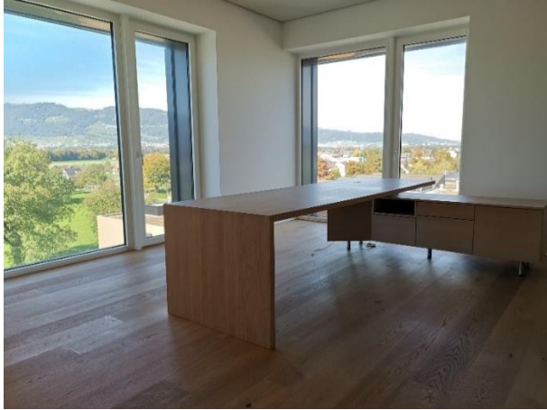
Fenster Westen / Norden