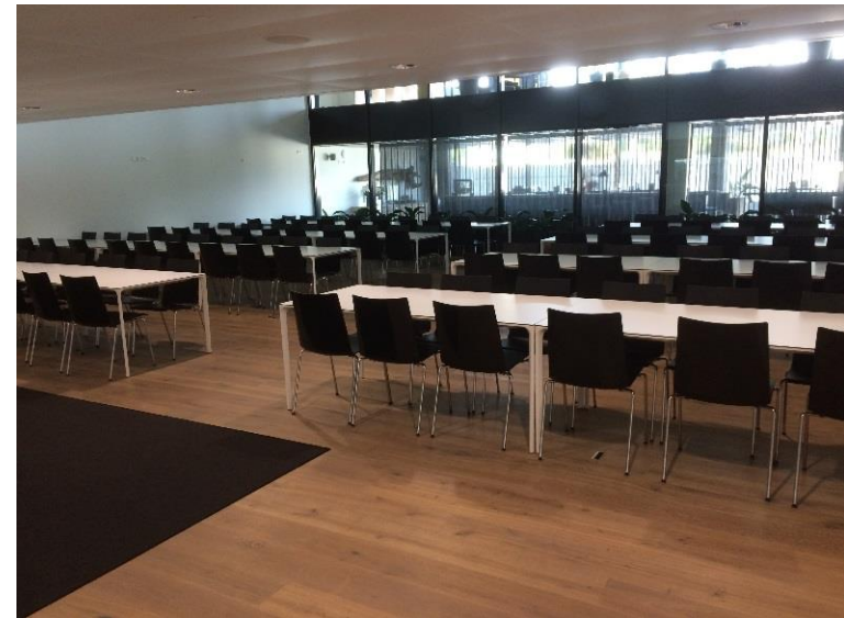
Aufenthaltsraum – Platz für bis zu 100 Personen

Platz für bis zu 150 Personen (Multimedialeinwand)