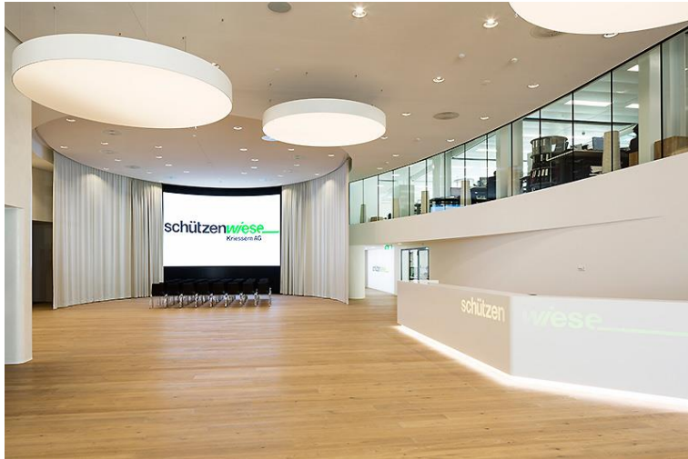
Empfang – Foyer

Platz für bis zu 150 Personen (Multimedialeinwand)